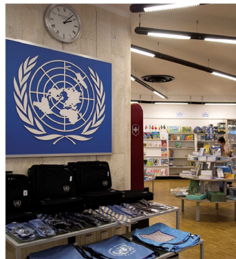
SOUVENIRS / LIBRAIRIE Bâtiment E - Étage 2