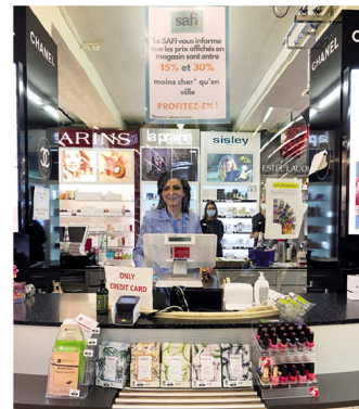
SAFI Bâtiment S - Étage 1

https://www.linkedin.com/company/united-nations-office-at-geneva