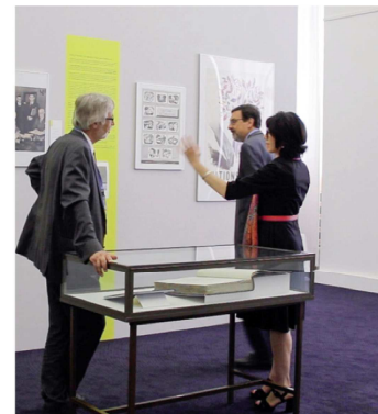
MUSÉE DES NATIONS UNIES À GENÈVE Bâtiment B - Étage 1