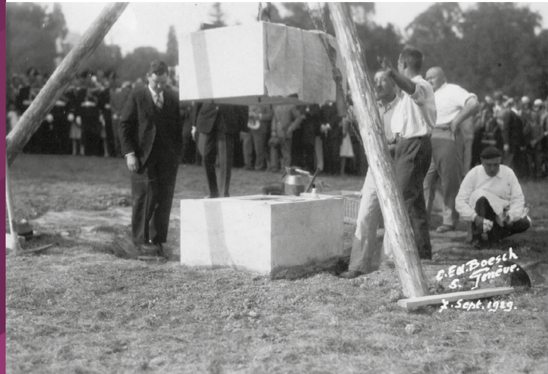
Laying of the foundation stone of the Palais des Nations on 7 September 1919 Pose de la première pierre du Palais des Nations le 7 septembre 1919