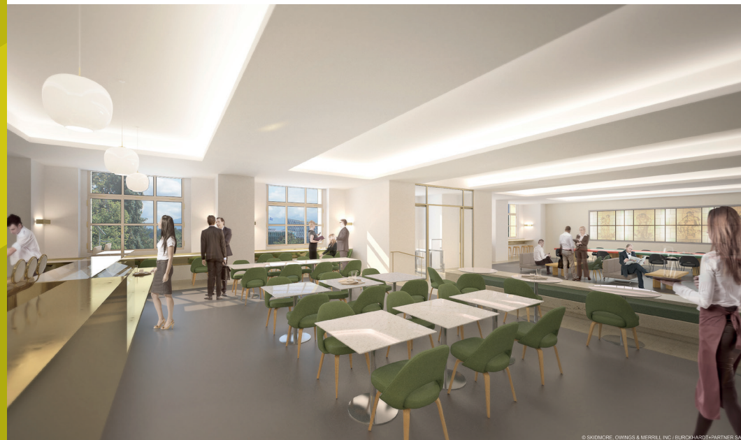
Renovated Press Bar / Bar de la Presse rénové