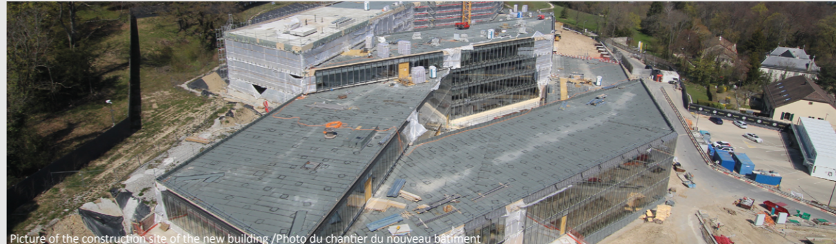
Picture of the construction site of the new building /Photo du chantier du nouveau bâtiment

Proposed solutions resulting from these ongoing investigations will certainly be based on medical advice, factual information and guidance from the Host Country and UN Headquarters. These activities will be focused not only on the new building, but also the existing buildings of the Palais.