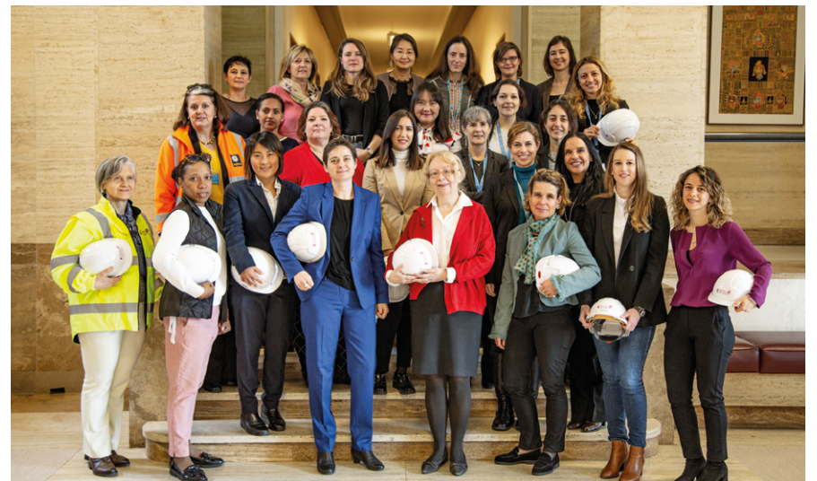
Group picture of women working on or contributing to the SHP project

Pour accéder à notre série d'articles : https://medium.com/@SHP_UNOG